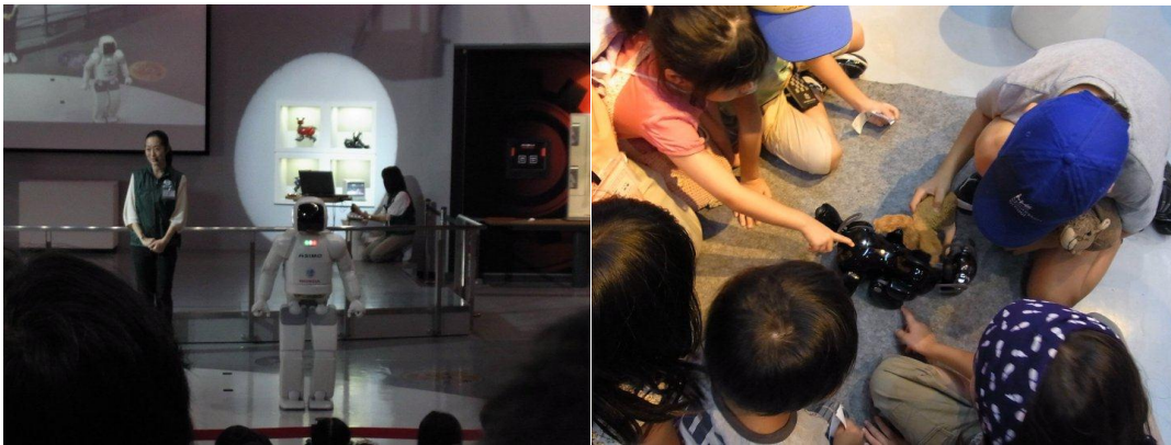
大御所やはり人気者です。