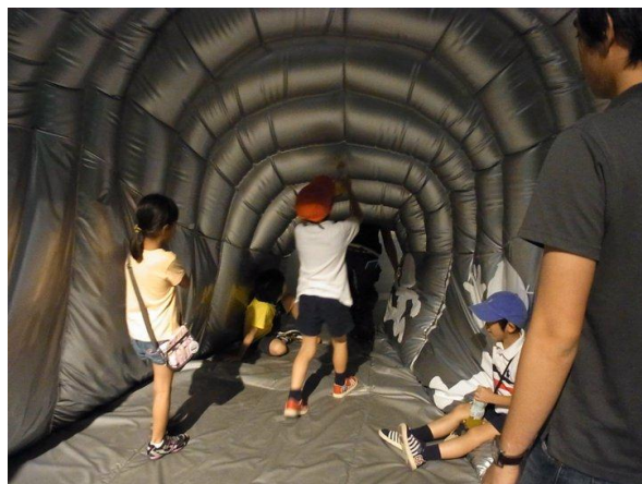
ガリバートンネル