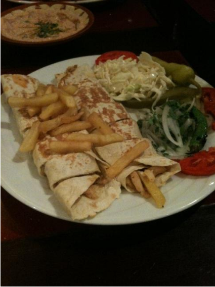
ケバブに近い食べ物