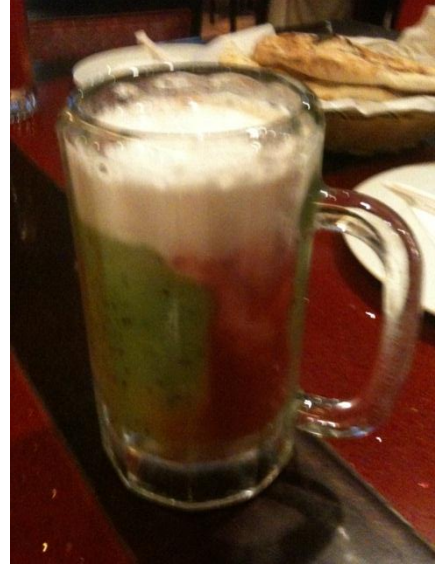
フレッシュジュース♥