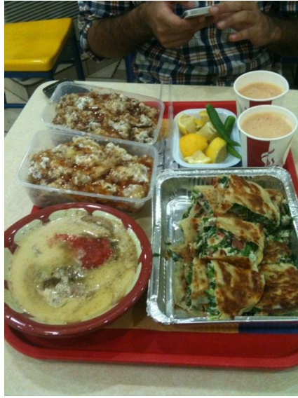
伝統的な朝ごはん