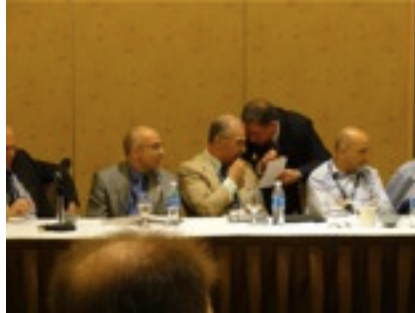
お気に入りのシーン