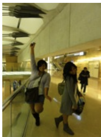
空港で仲良くなった二人。友情ってやつア・・つき合った時間とは関係ナッシング！！