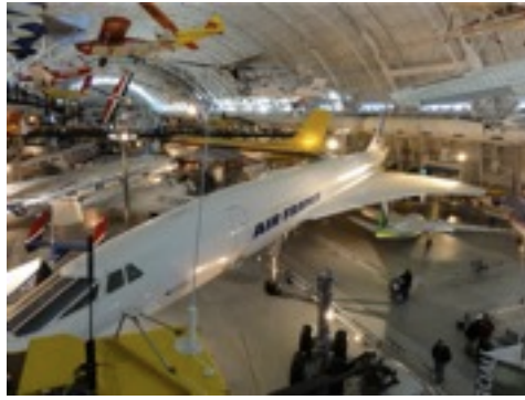
感動のコンコルドとの出会い