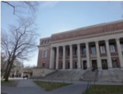
ハーバード図書館