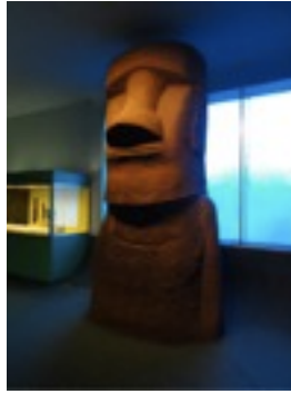
You dumb dumb! I want gum gum!