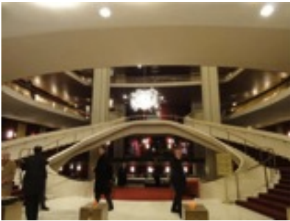
オペラ。リンカーンセンターにて