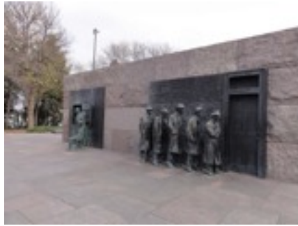
ルーズベルト記念碑