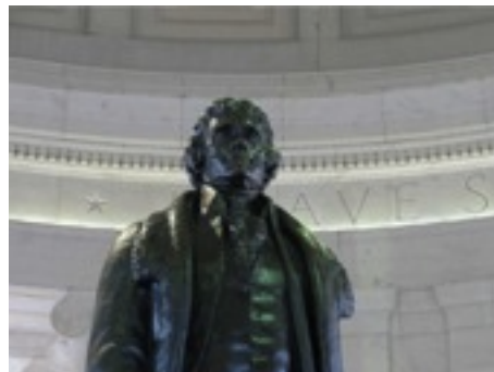
ジェファソン大統領