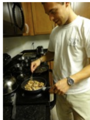
最高のルームメイト。面白いやつだけど、 ちょっと昼間起きてるところを見るのは難しい