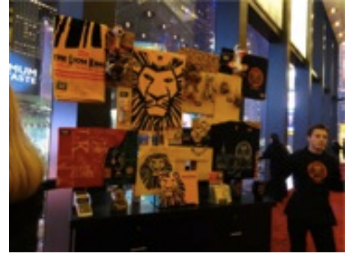
MUSICAL LION KING