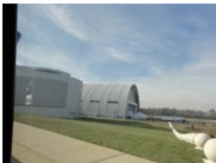
この世の天国、ワシントン航空博物館別 館（本館の数倍巨大）