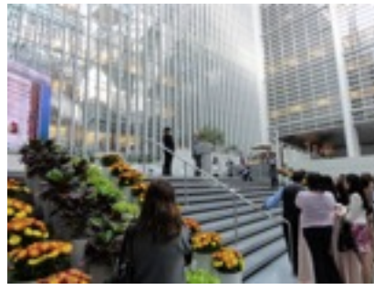
ワールドバンクでの講演会の様子。 だいたい毎週催し物がある