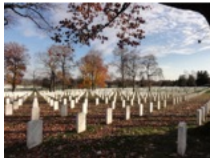
アーリントン墓地 戦死者たち