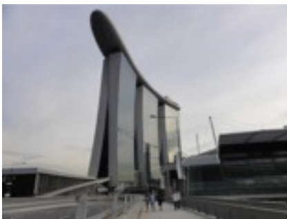
会議のあったホテル。みんな屋上のプー ルは結局時間がなくて泳げなかった様子