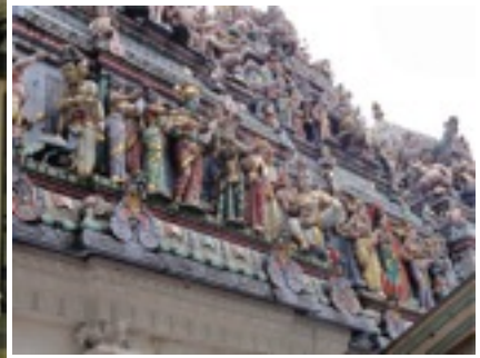
インドの影響のとても強いシンガポール