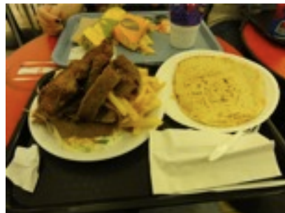
でっかいご飯。一番のお気に入りGYRO量的にすごく見えるが実は食べきれ