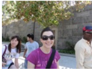
尊敬すべきドイツ生まれのアメリカ人。大学二回目。ずっと勉強を続けるタイププログラムの中で最も仲良くなった人の一人