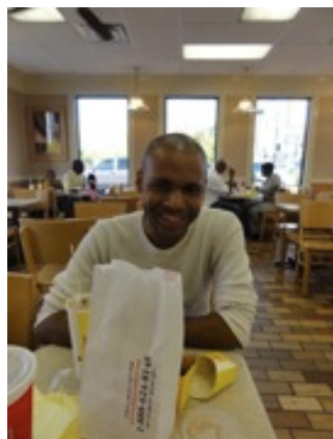
ルームメイトその2 すっごく人のいいやつ。 何故かルームメイト1とよくケンカしてた。