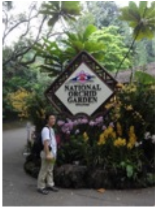
NATIONAL ORCHARD GARDEN シンガポールの友達と再開。ロンドンで 会ってからたったの3ヶ月