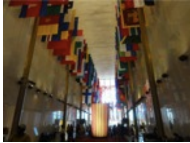
ケネディーセンターいつも何か無料のコンサートをやっている。この日はメキシコとの記念年で、メキシコのフェスティバル