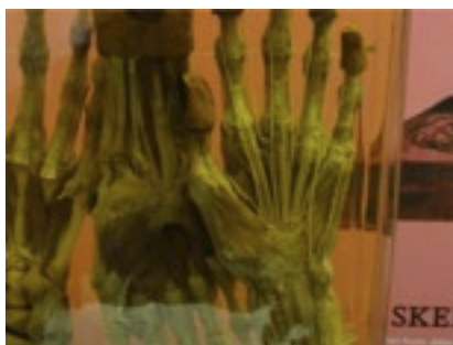
遠足で行った軍の基地の中にある医学博物館。ここまでの仕事はもはや芸術