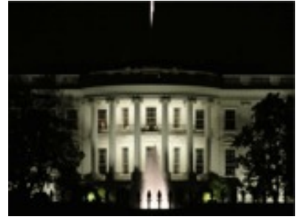
ホワイトハウス もちろんセキュリティーは最高