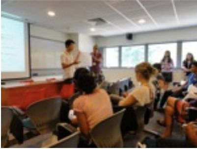
シンガポールにて。SPEEDの集会の写真 意外とすごい生徒が揃ってた