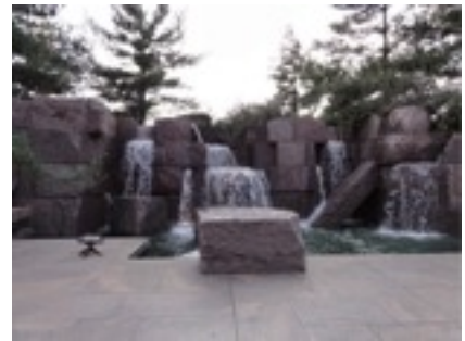
ルーズベルト 続き