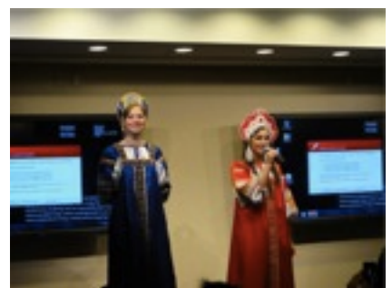
アメリカに帰国。すぐに INTERNATIONAL PARTY がありました 写真はロシア人の組とっても偉そう