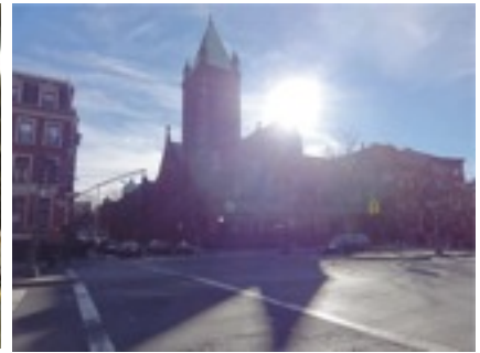
クリスマスイブの朝の教会