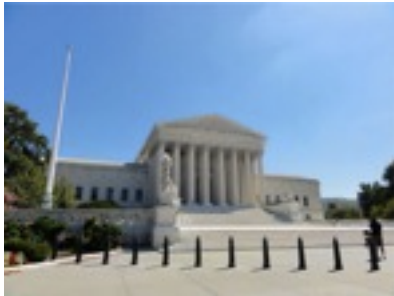
お気に入りの国会図書館