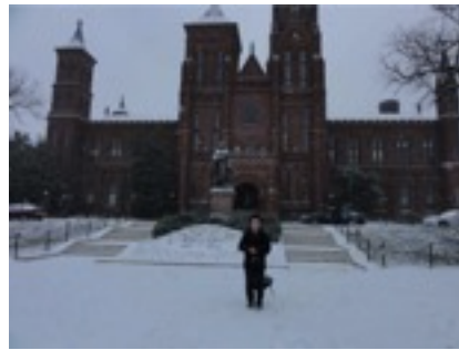
スミソニアン博物館