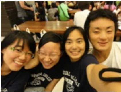
LONDON INTERNATIONAL YOUTH SCIENCE FORUM の友達 久しぶりの再開