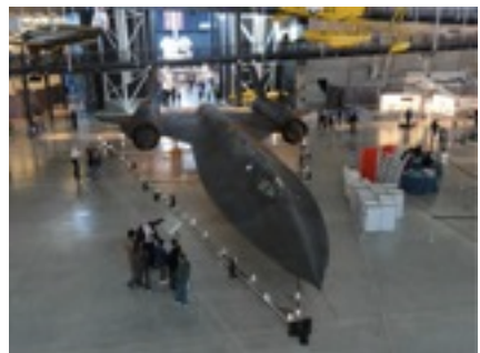
SR71 ブラックバード。有人ジェット機 世界最速。