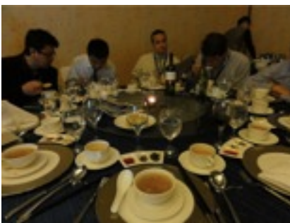
GEDC DINNER こういう席では とってもいい料理が出る ただし味は超中立的