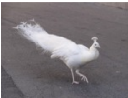
ありえない、、、野生白孔雀 何故か大聖堂に住み着いているのだそう