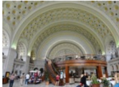
UNION STATION 最寄りの駅その1 ワシントンでも最も大きい駅でも夕方になるとすぐ店が閉まる