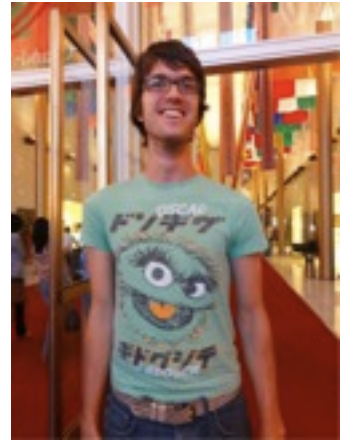
謎の呪文の書いてあるTシャツ