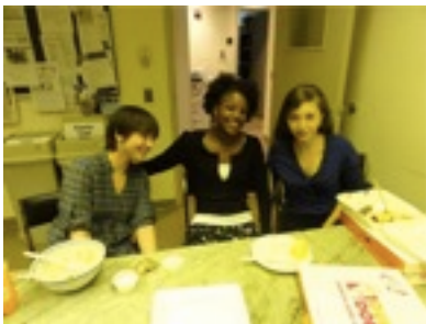
仕事場の同僚たち とっても早口