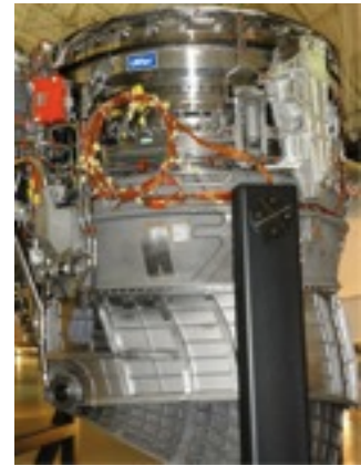
ハリアーのエンジン。推力方向偏向ノズルが微妙に写ってます