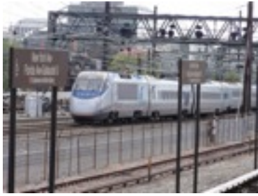
見た目は普通にTGVみたい。でも乗り心地は新幹線と比べると天と地の差。飛行機より揺れるのに飛行機と同じ値段 AMTRAC