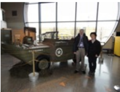
小さすぎて見えないけど、IEEEのポストンのエージェントとの対談