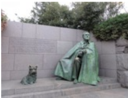
ルーズベルト と犬 石に刻まれた言葉は とてもパワフル