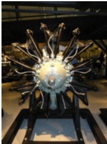
願い事を叶える星型エンジン