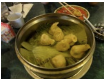
テキトーに作った雰囲気満点の小籠包湯 あじは、まあまあ、醤油はスコア20点くらい