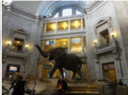
お気に入りの自然科学博物館。 タダだから毎週行く