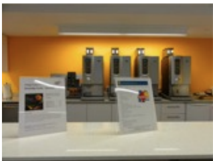
エコを追求したビル。でもどうしてその コーヒーマシンを4つ置く？