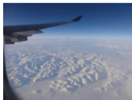
出張にシンガポールへ移動中 ロシアの上を飛んでいるところ？