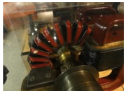
アメリカ博物館。エジソンのコーナー モーターの試行錯誤に本当に感動