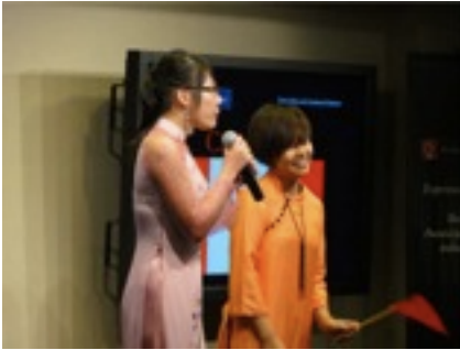
ベトナム人グループ