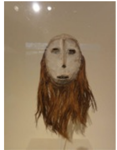
MUSEUM OF FINE ART BOSTON どこに行ってもあるこのお面