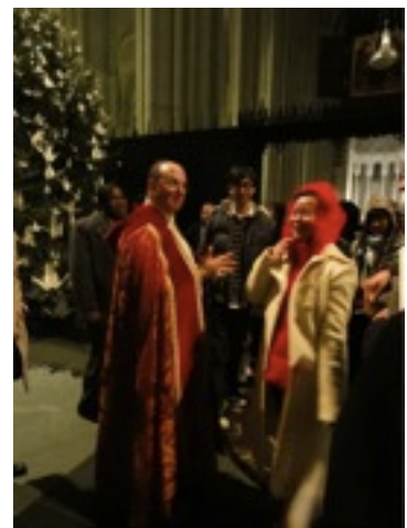
かなりえらい人。「私は主教ではないからね、帽子はかぶれないんだ。はは。もちろん教会の外ではかぶるよ」本人談