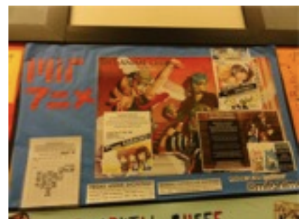
MITにもアニメ研究見。なかなか流行を追ってみたい