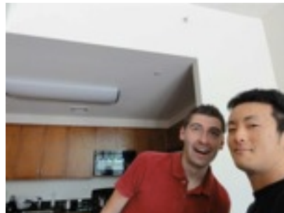
変わった趣味を持った友達(赤いシャツ)と 2ショット。本人とってもその趣味に自信を持っていらっしゃる