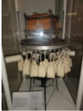
日本の知恵の結晶. 風船爆弾