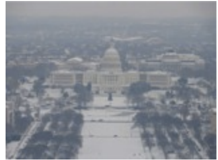
雪の積もったUS CAPITOL FROM WASHINGTON MONUMENT