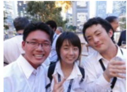
左、パーティーに慣れず飲み過ぎてしまった友達。真ん中、最後に ミスキャンパスであることが判明。。