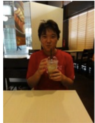
あの有名な IMF社員との対談。ちょっと 若いけど、間違いなくワシントンのIMFに 勤めてる