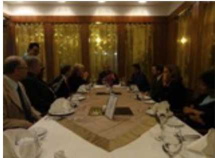
マレーシアが近いので、ボスと一緒に UTMに呼ばれたときの夕食 伝統衣装で迎えてくれました