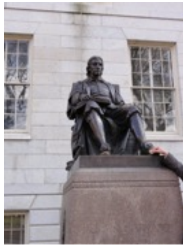
ハーバード初代学長 実は違ってる噂