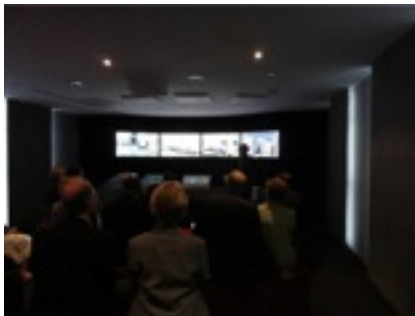
SIEMENS シンガポール支社にて。会社理 念のプレゼンテーションを聞く会議の キーパーソンたち