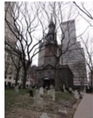
WORLD TRADE CENTER 跡地の脇の教会。中には記念のものがたくさん。