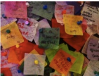
ここからニューヨークへ移動 よくみると