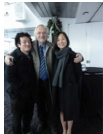
ボスとおわかれクルージング