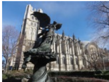
西半球最大 ST. JOHN'S CATHEDRAL