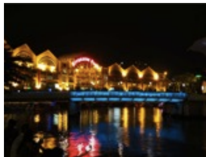
シンガポールの有名な夜景スポット