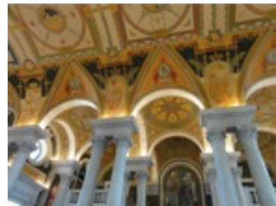
国会図書館内部 幸せな勉強時間？