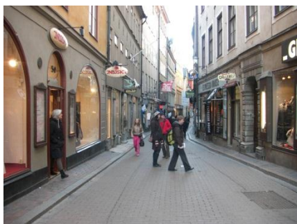
旧市街ガムラ・スタンの通り