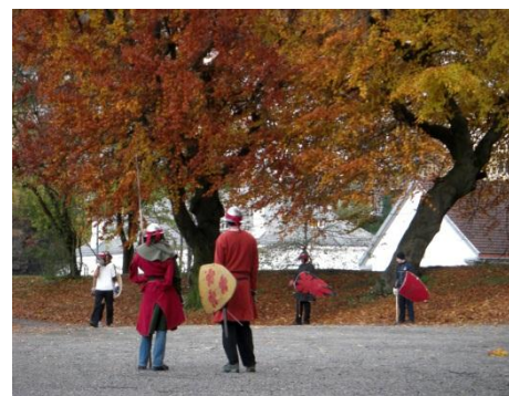
ヴァイキングたちが戦っている