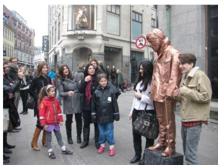
大道芸人と観光客