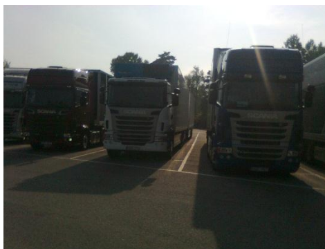
これらの中から好きな車を選んで…