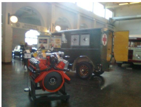
昔の車とかがある