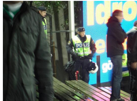
警備に目を光らせるポリース