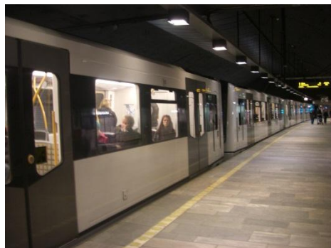
トラムと相互乗換可能な地下鉄