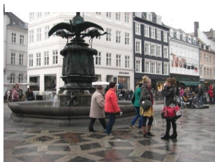
メイン観光ストリート、ストロイエの中心部