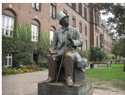
アンデルセンの像