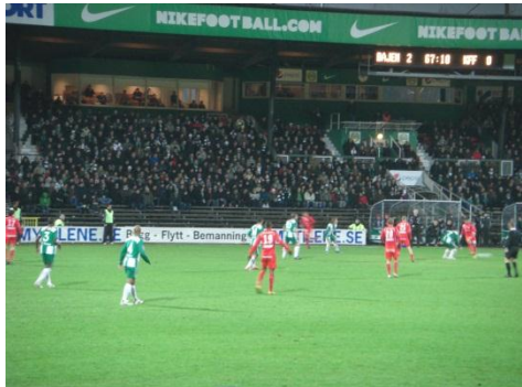
超満員のスタジアム