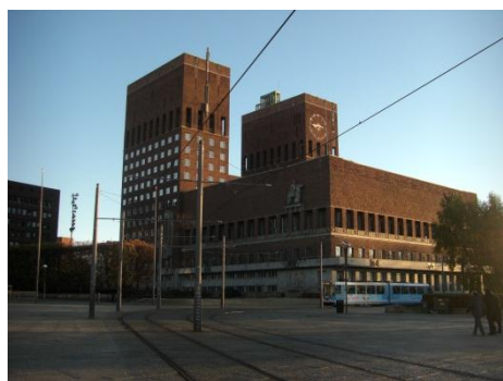
ノーベル平和賞授賞式が行われる オスロ市庁舎