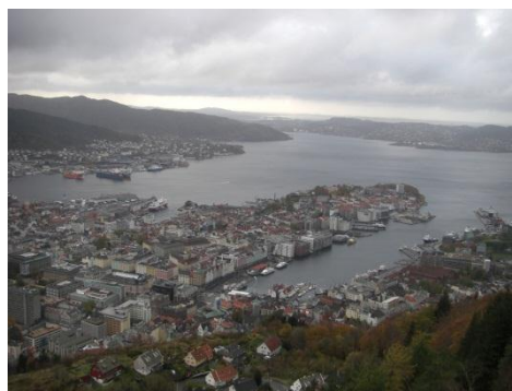
山の上から見たベルゲンの港