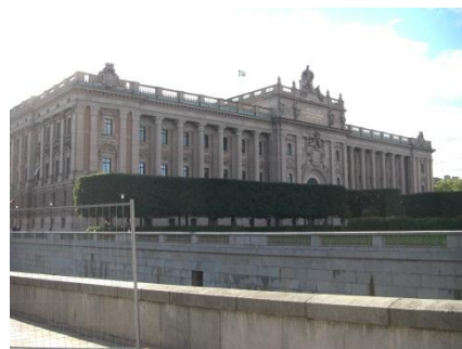
スウェーデンの国会議事堂。い い角度