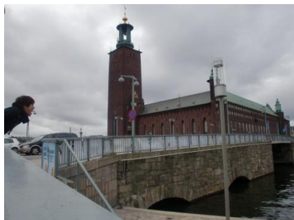
ノーベル賞祝賀晩餐会の行われる ストックホルム市庁舎