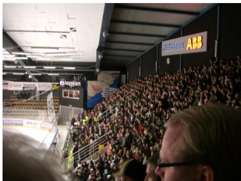
超満員のスタジアム