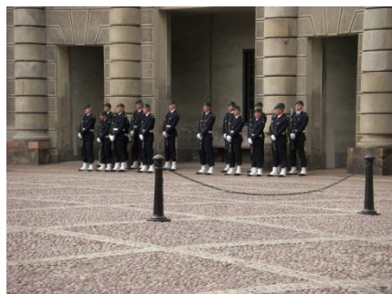
交代を今か今かと待つ衛兵さん …寒いから早くして