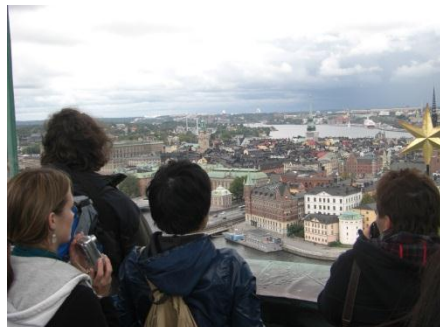
ストックホルム市庁舎の展望台 から