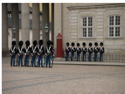
衛兵交代式…頭重い