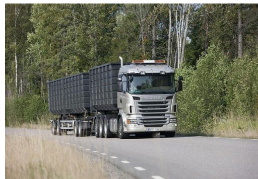
会社の敷地内を運転してみた（初めての左ハンドル&超大型車