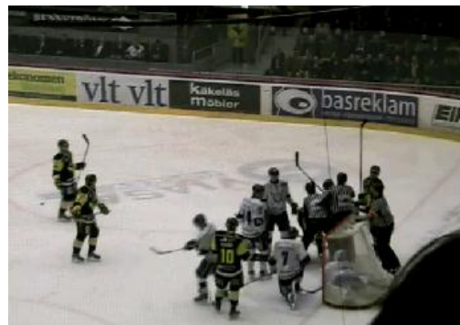
何やらもめている