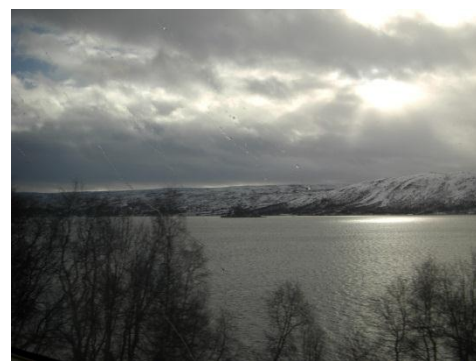
壮大なフィヨルド