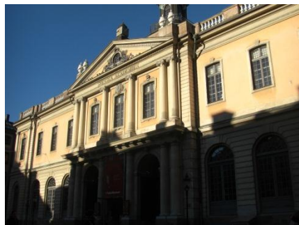
ノーベル博物館 (一部改装中)