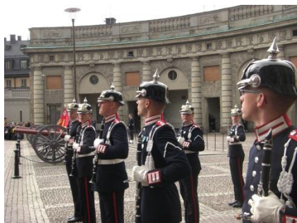
衛兵交代式マーチングバンド (王宮)