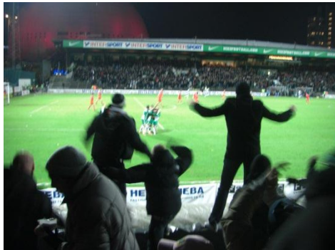
点が入り喜ぶハマベイのサポーター