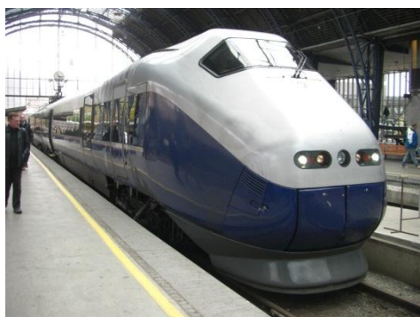
オスロ～ベルゲン間を結ぶ山岳鉄道、ベルゲン急行