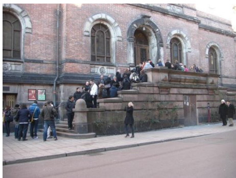
国立美術館。ムンクの「叫び」がある