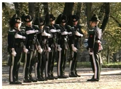
衛兵交代式…短剣をしまって