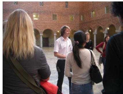
ストックホルム市庁舎見学のガイド ツアー。テレビで見るより狭い気が