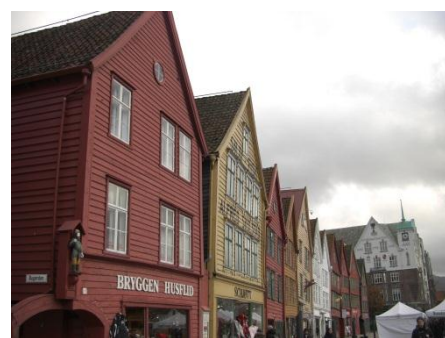
世界文化遺産の建物らしい