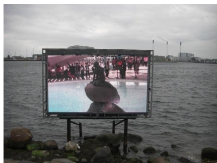
人魚の像。上海万博に貸出中で、リンクした映像が公開中