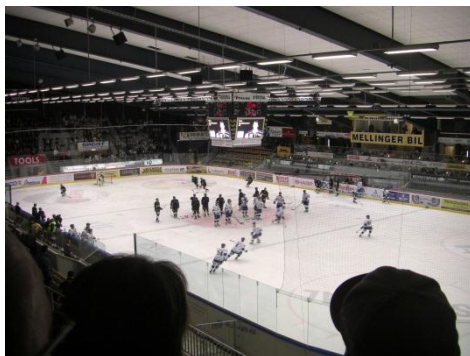
リンクは意外と小さい