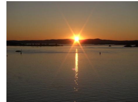
オスロフィヨルドとサンセット