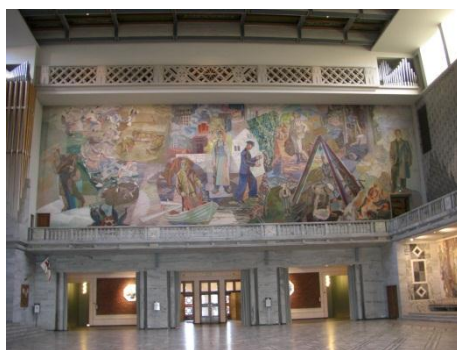
オスロ市庁舎内部。ヨーロッパ最 大級の油絵